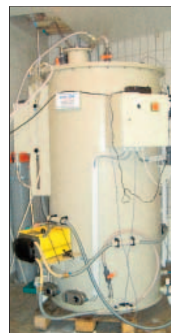
Der Bioreaktor stand sechs Monate bei der Käseerei André im Test.